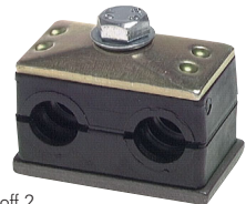
Kunststoff 2 Doppelrohrschelle mit Anschweiß- und Deckplatte