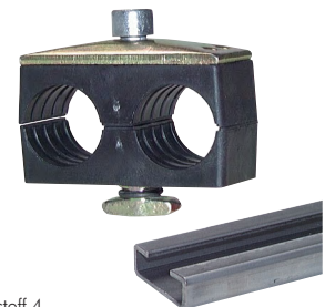
Kunststoff 4 Doppelrohrschelle mit Deckplatte und Tragschienenmütern Typ KMA zum Aufbau auf C-Tragschiene TS 28 ... (Seite 436)